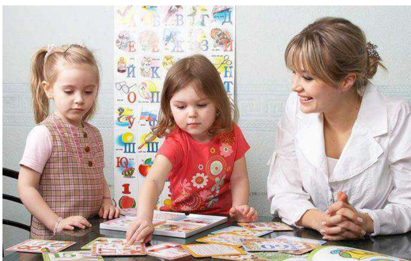
Коррекционные занятия с логопедом

В комплекс логопедических занятий, помимо работы по постановке и автоматизации звуков, обязательно должны входить задания по развитию внимания, памяти, узнавания зрительных образов, мелкой моторики, слухового сосредоточения [4].